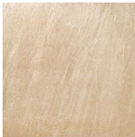
ZWX53 STONELITE CREAM 45x45

Old amber shade that, between the glossy and the matt, emphasizes the stone character giving an effect of light porosity.