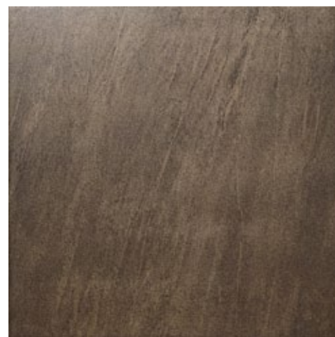
ZWX56 STONELITE BROWN 45x45

Янтарный цвет с привкусом античности, сочетающий яркий блеск и в тоже время матовый эффект, возвеличивает природу камня с эффектом видимой пористости.