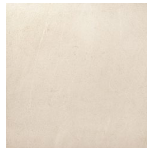
ZWX51 STONELITE IVORY 45x45

A light and luminous surface with a polish effect to use different types of light, from the natural to the artificial.