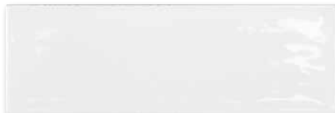
Esencia Blanco Brillo