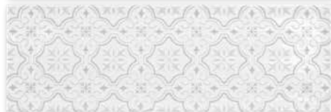
Luna Blanco — Available in all colours