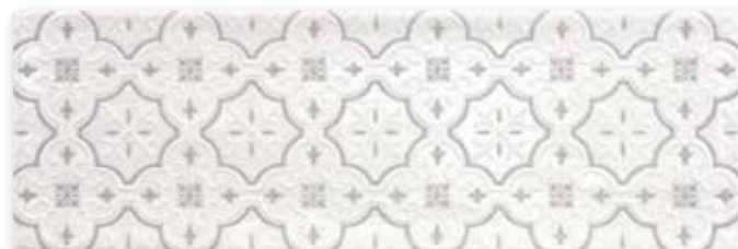
Isabel Blanco Mate