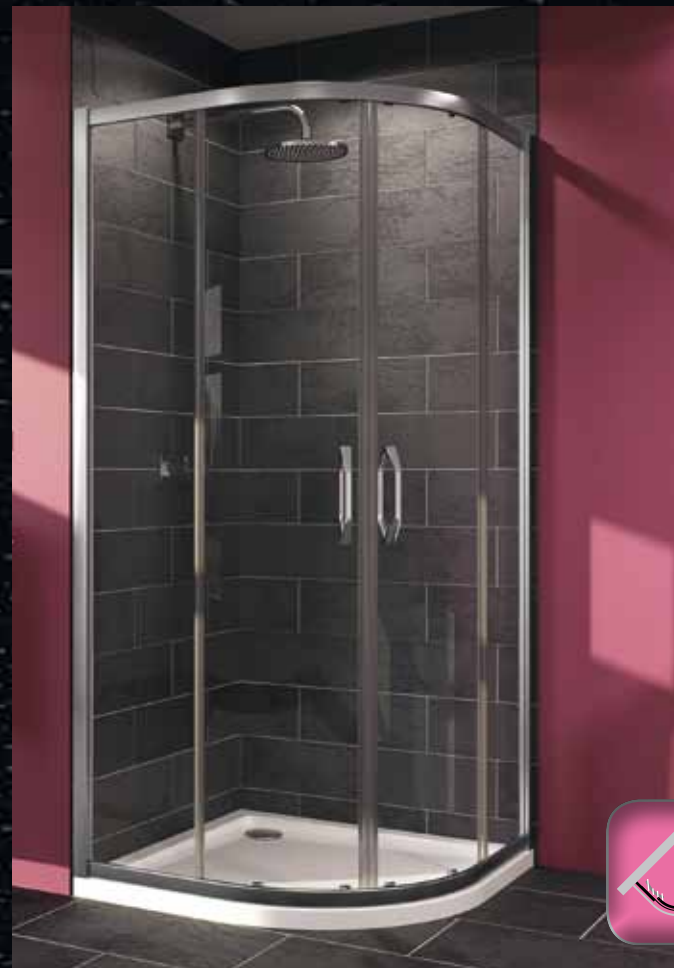
Раздвижная дверь 1/4 круга