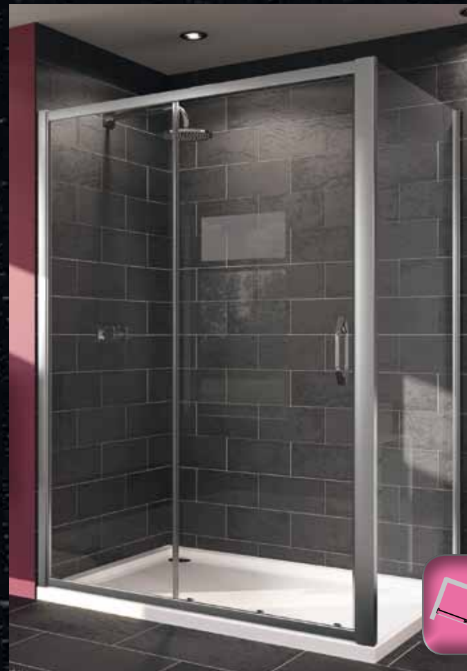
Раздвижная дверь с неподвижным сегментом для ниши или в комбинации с боковой стенкой