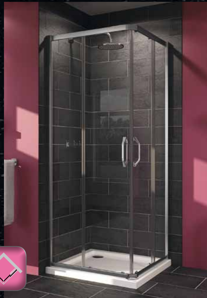
2х-секционная раздвижная дверь