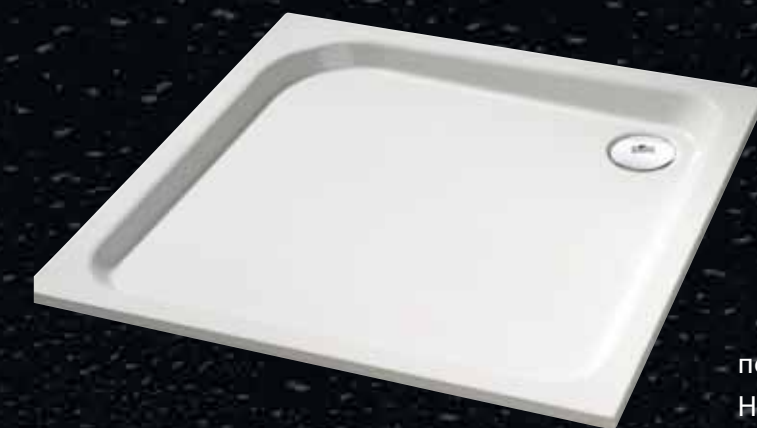
поддон HÜPPE Verano

HÜPPE X1 плюс душевой поддон HÜPPE Verano в комплекте по отличной цене!