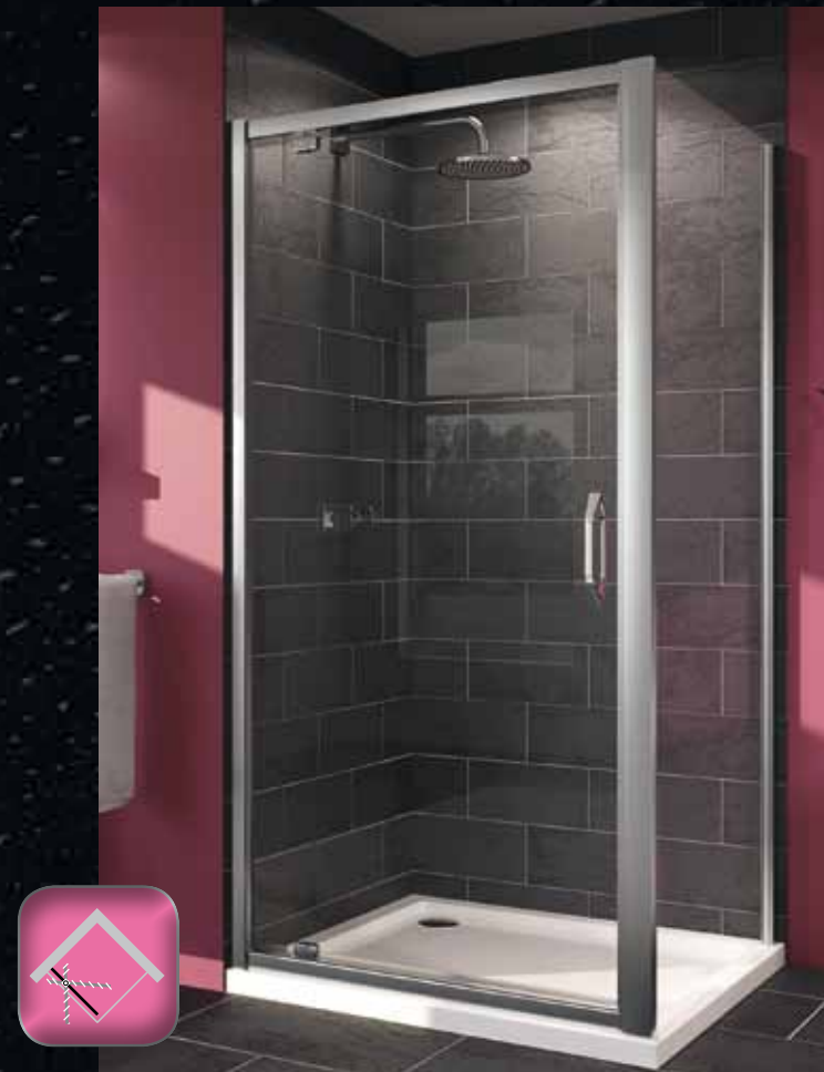
Распашная дверь для ниши и боковой стенки

Раздвижная дверь 1/4: Стандартная ширина 800 x 800 мм, радиус 500