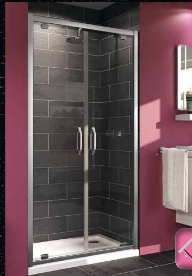
Распашная дверь для ниши, открывающаяся наружу и вовнутрь