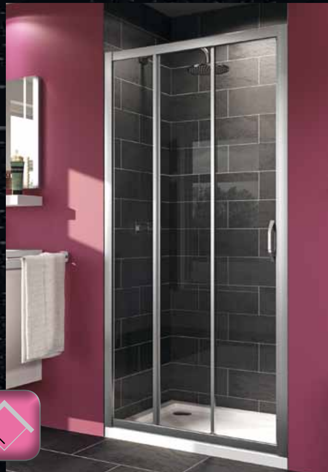
3х-секционная раздвижная дверь с неподвижным сегментом для ниши или в комбинации с боковой стенкой

Раздвижные двери с боковой панелью: Стандартная ширина 1000 мм x 1000 мм